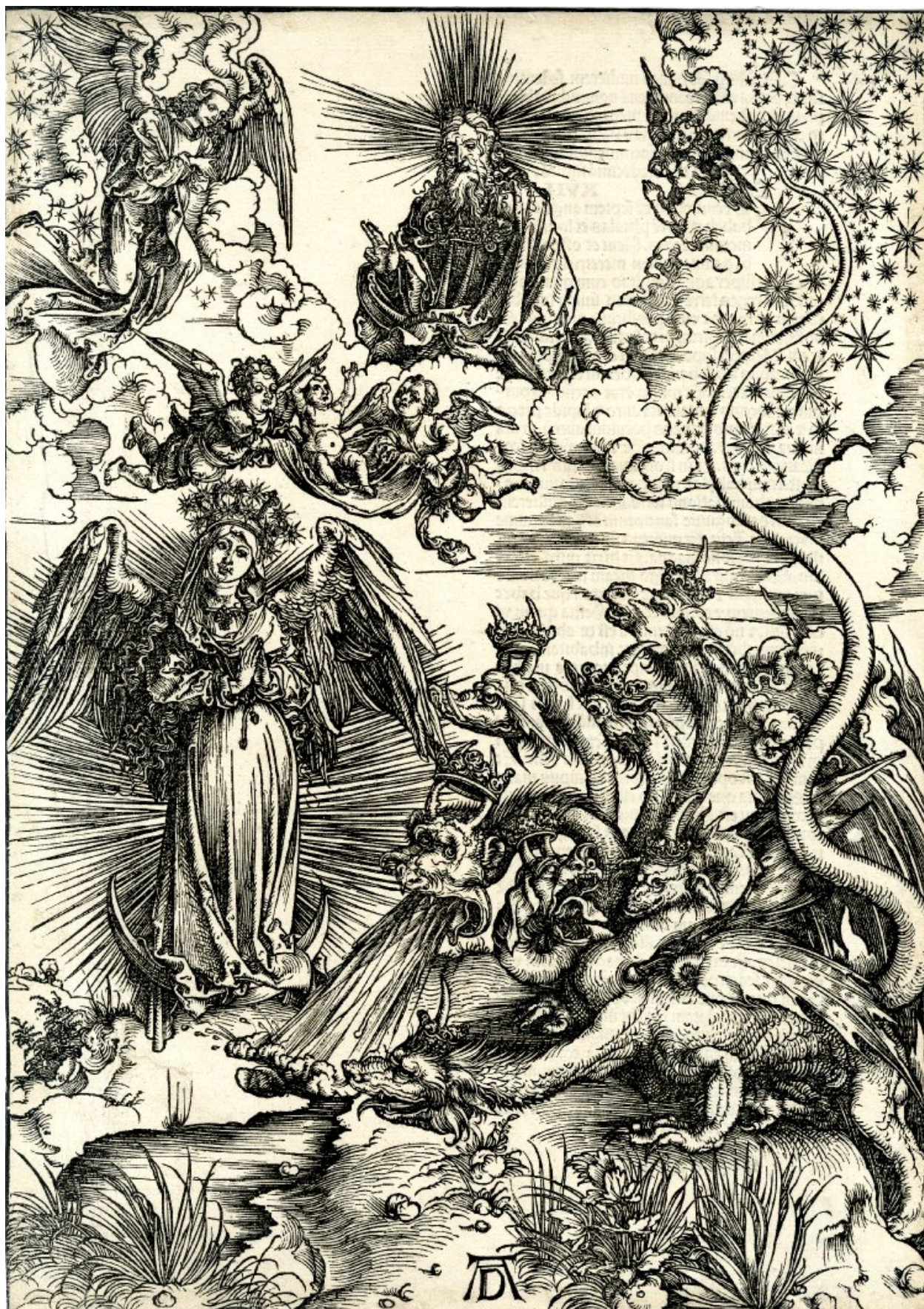
2. Альбрехт Дюрер. Жена, облаченная в солнце, и семиглавый дракон. 1497.