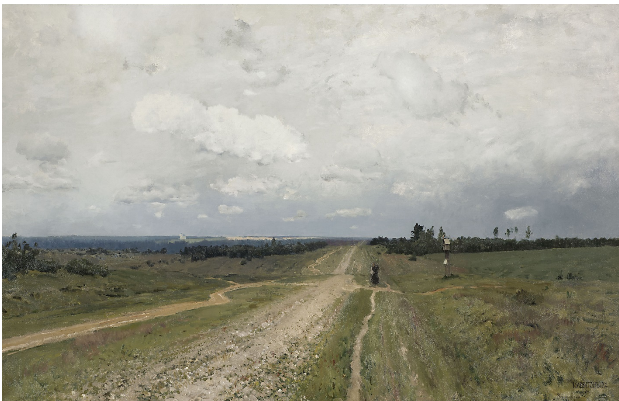
1. Исаак Левитан. Владимирка. 1882.

Выберите один из предложенных шедевров и проанализируйте его, указывая на индивидуальные особенности произведения, стиль автора и характерные черты эпохи, к которому относится данное произведение. Порассуждайте о том, какое место данное произведение занимает в творчестве автора и в истории искусства в целом, каково его значение для культуры. Выразите свое отношение к этому шедевру.