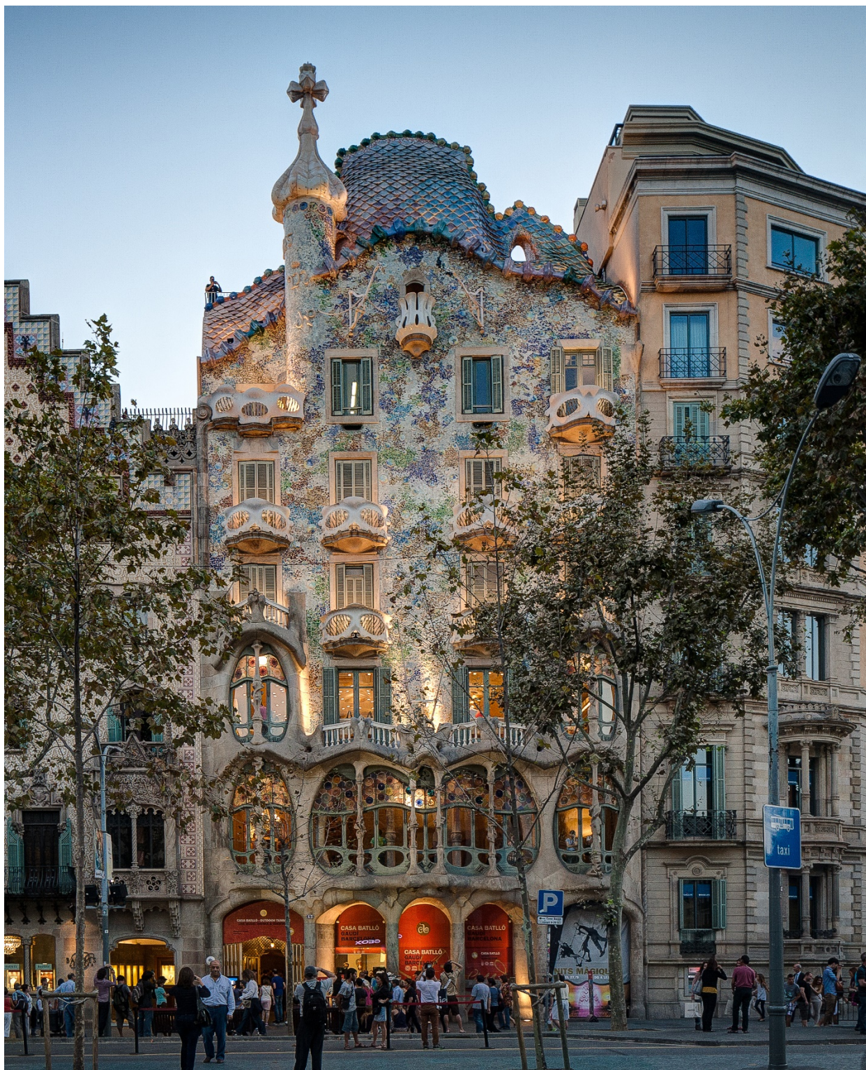
3. Антонио Гауди. Каса-Батльо. 1904-1906 гг.